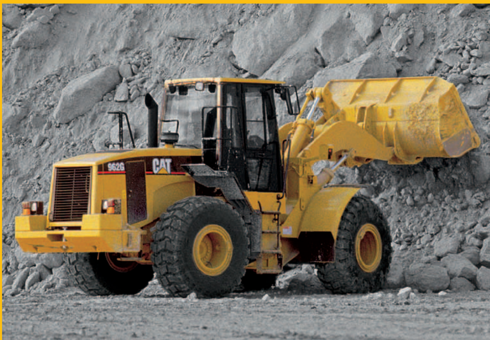
CAT Certified Power Train 962G