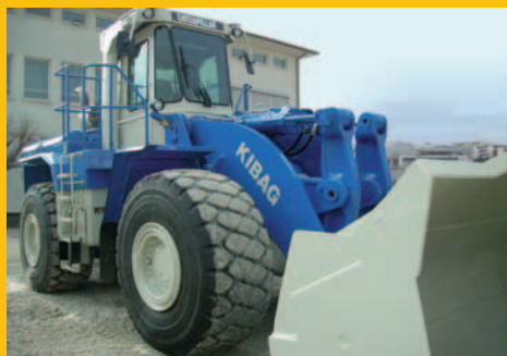
CAT Certified Rebuild 980C