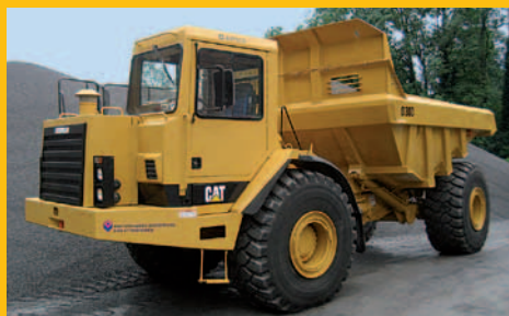
CAT Certified Rebuild D30D

Avesco AG a déjà révisé avec minutie et selon les directives les plus strictes plusieurs machines et dispose de ce fait d'une vaste expérience et d'excellentes références.