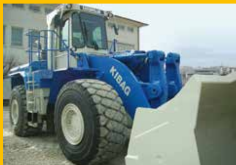
Cat Certified Rebuild 980C