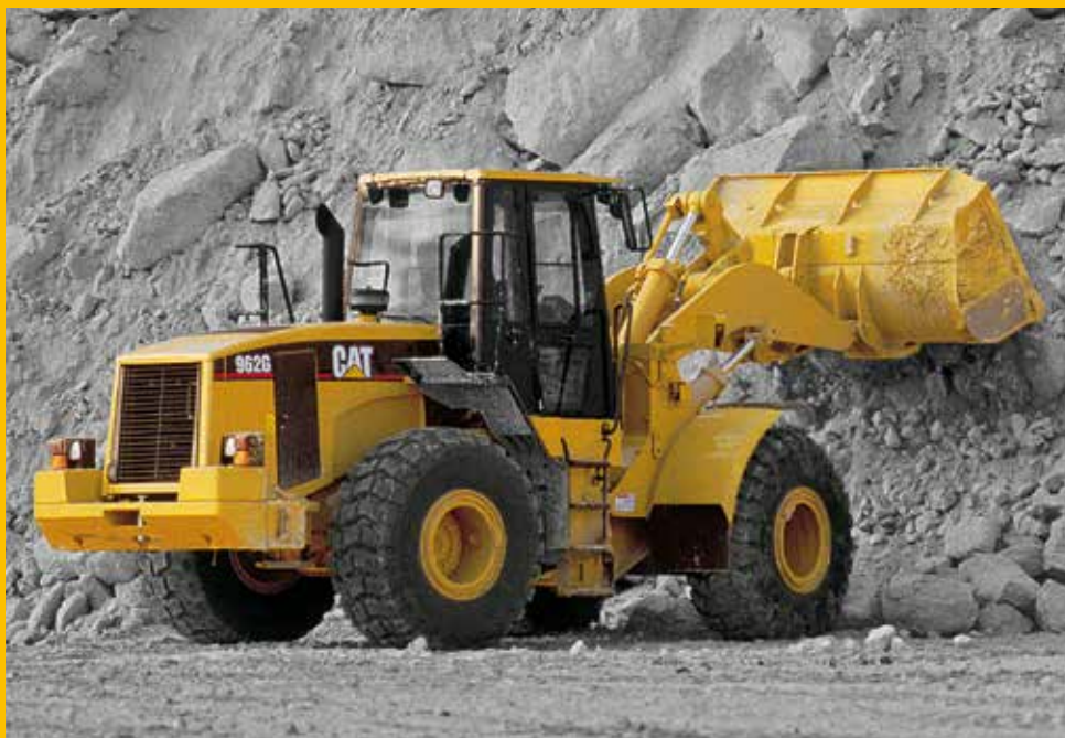
Cat Certified Power Train 962G