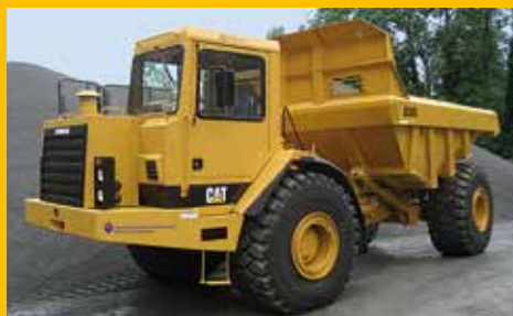
Cat Certified Rebuild D30D

Avesco SA ad oggi ha eseguito con precisione e secondo le più rigorose direttive del fabbricante revisioni totali a più di 30 macchine. Maturando così esperienza ed ottime referenze.