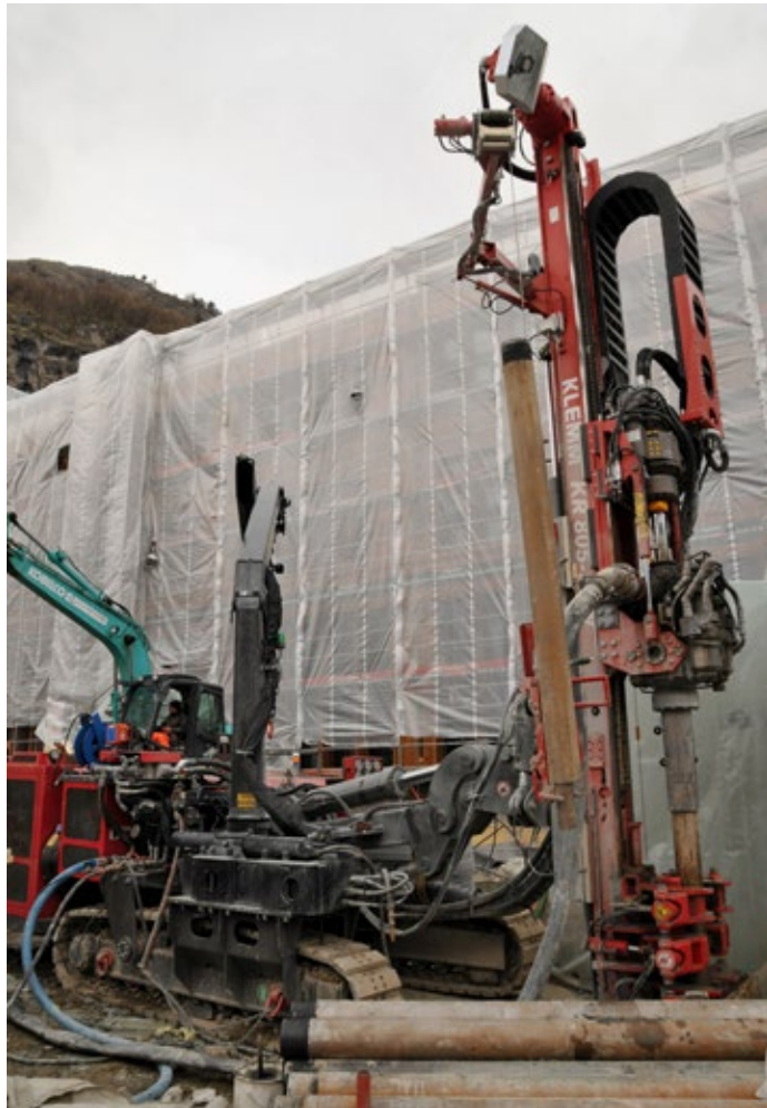
Avesco, Baustelle Zermatt, Erdsonden-Bohrgerät Klemm.