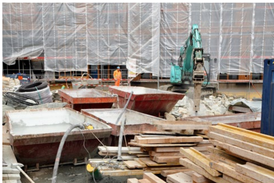
Avesco, Baustelle Zermatt, Erdsonden-Bohrgerät Klemm, Mulden für Bohrrückfluss.