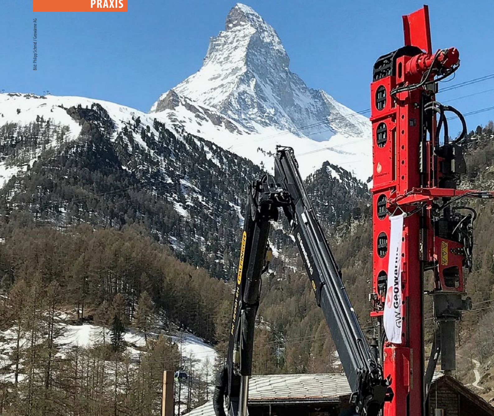
Avesco, Baustelle Zermatt, Erdsonden-Bohrgerät Klemm, Matterhorn.