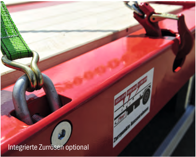
Integrierte Zurrösen optional