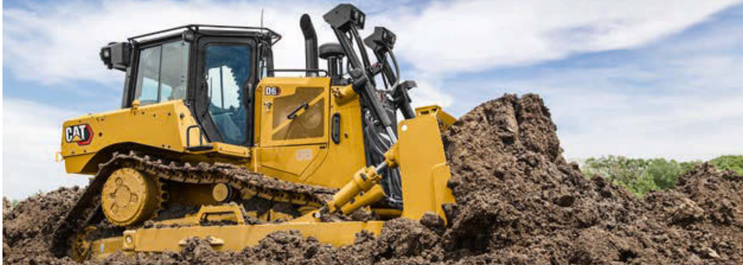
Novità 2019: il dozer diesel-elettrico D6 XE della Caterpillar.

150 – da Ammann e Avesco il 2019 è all'insegna di un compleanno rotondo. Sì, perché è proprio un secolo e mezzo fa che nasceva la storia delle due imprese. Nell'anno del giubileo, lo sguardo tuttavia è rivolto soprattutto al futuro.