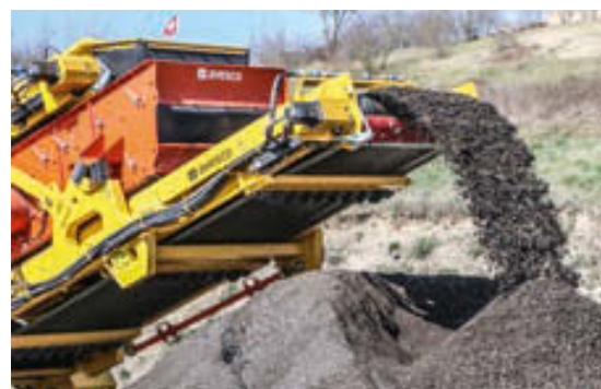
Ecco il punto forte: vaglio a due livelli in uscita.

Un altro fattore determinante è la maggiore flessibilità. Ora, nei periodi di cattivo tempo, quando piove, nevicata e la frantumazione dei materiali in cava deve pertanto essere sospesa, ci dedichiamo a pieni ritmi alla preparazione di inerti per il riciclaggio. L'immediata operatività è assicurata senza dover più