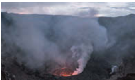
I gas generati dall'attività vulcanica del Monte Nyiragongo contribuiscono al rischio di un ribaltamento nel lago Kivu.

Il lago Kivu, che si divide tra Ruanda e Repubblica Democratica del Congo, contiene circa 60 milioni di metri cubi di metano e 300 miliardi di metri cubi di anidride carbonica.