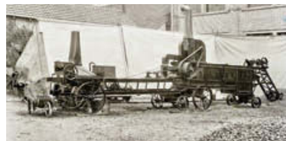
Macchina per pavimentazione in macadam (anno 1908).

Il sistema permette di combinare facilmente diversi agenti energetici sostenibili come l'e-gas, il biogas, l'energia solare e il calore residuo. In questo modo un immobile può essere riscaldato senza emissioni di CO 2 , risparmiando inoltre sui costi. ■