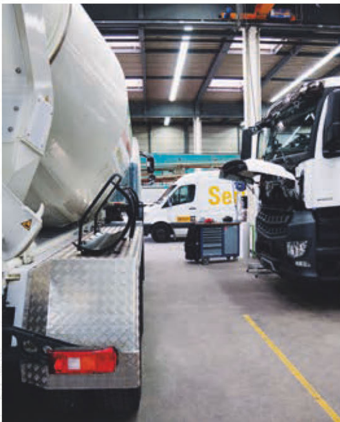
Allestimento veicoli industriali di qualità presso la sede di Langenthal.

Nel 2015 Avesco ha creato un centro specializzato nell'allestimento di veicoli industriali. All'interno del centro, ubicato presso la sede di Langenthal su una superficie di oltre 1'000 m 2 , si realizzano sovrastrutture, riparazioni e revisioni per betoniere e pompe beton. Una squadra di esperti, di comprovata esperienza e competenza, offre soluzioni commisurate alle esigenze per un trasporto efficiente nel settore del beton.