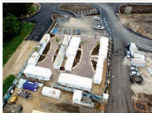
▼ La sala di controllo EMSolutions dedicata creata all'interno del cantiere consente di monitorare in tempo reale lo stato delle macchine.