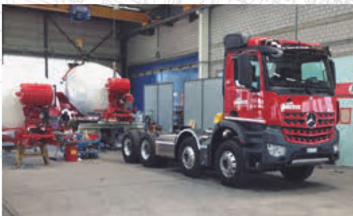
Sistema a cambio rapido, struttura a ganci o fissa, tutto è fatto in casa Avesco.