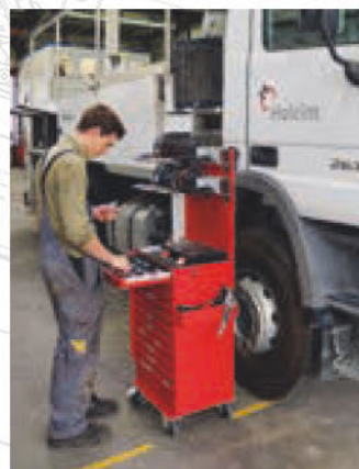
Professionalità ed efficienza.