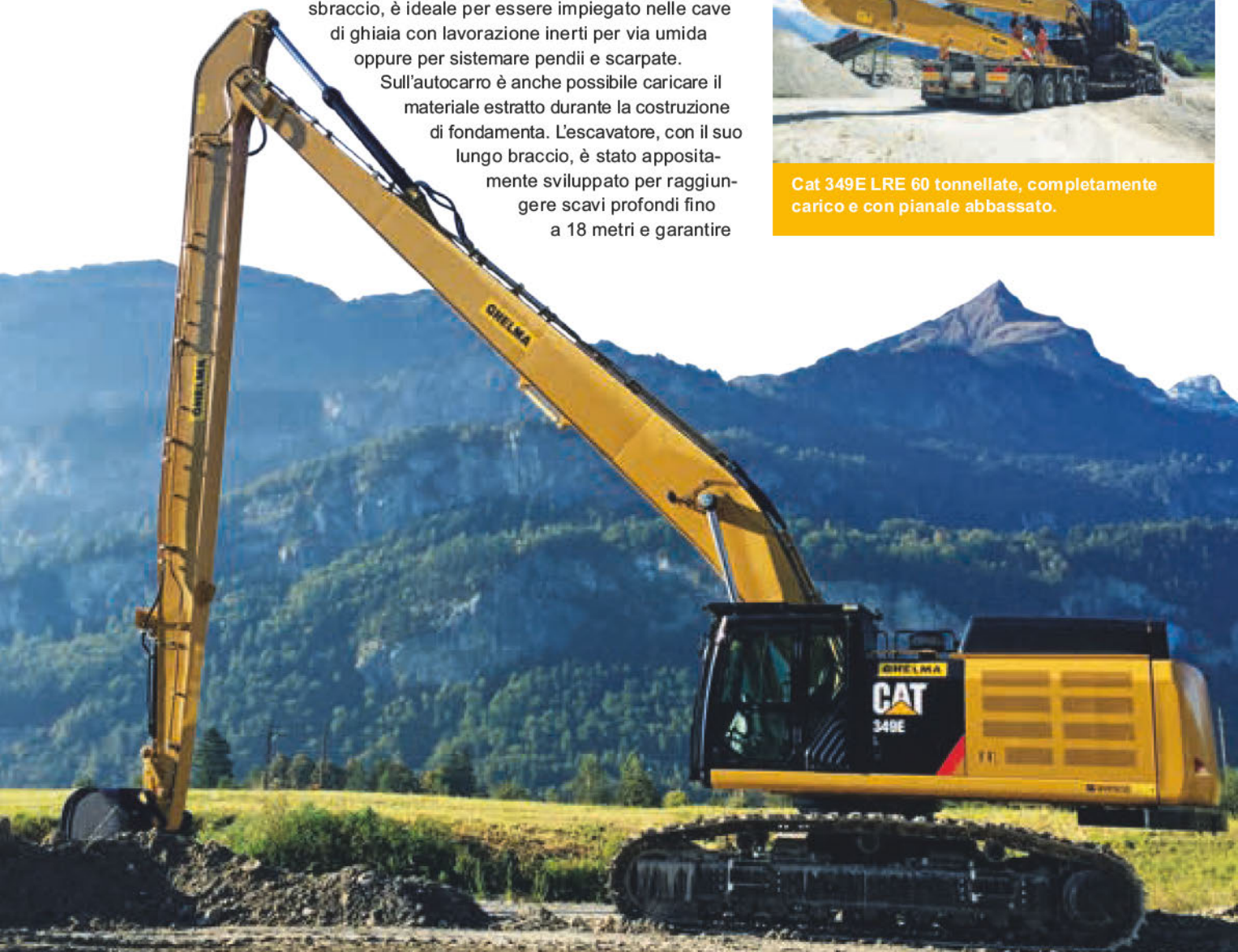
Cat 349E long reach all'opera in cava di ghiaia.