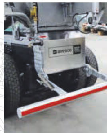
Dispositivo di protezione made by Avesco.