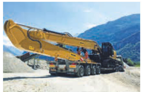
Cat 349E LRE 60 tonnellate, completamente carico e con pianale abbassato.

Il Cat 349E long reach ha un peso operativo di quasi 60 tonnellate, ma è facilmente trasportabile e può essere subito messo in funzione. Con questo escavatore la ditta Ghelma AG dispone di una macchina flessibile, potente e pronta a intervenire in caso di inondazioni, perfetta per svuotare griglie o liberare ponti.